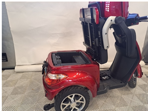
Nosta penkki ylös.