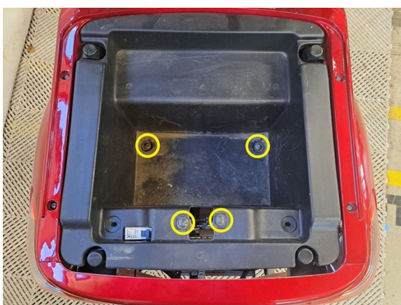
Irrota säilytyslokeron kiinnityspultit. (hylsy 8 mm).