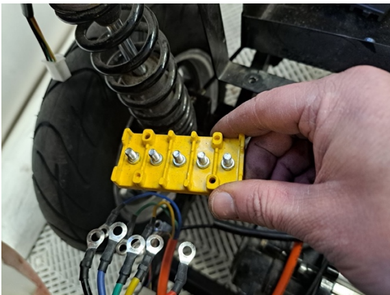
Ota johdot irti.

Uuden osan asennus käänteisessä järjestyksessä.