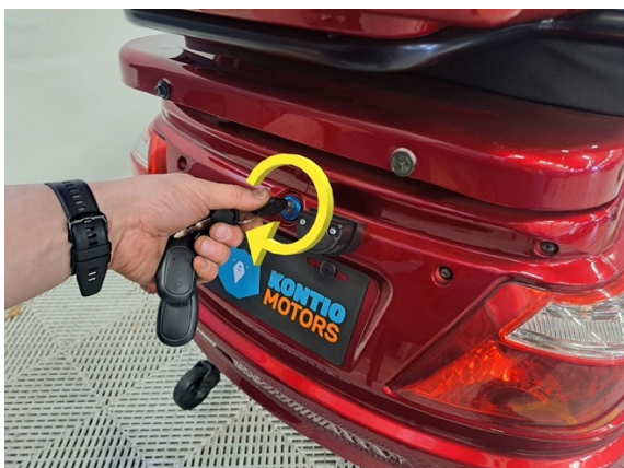
Avaa penkin lukko avaimella.